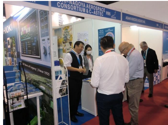
あいち・なごやエアロスペースコンソーシアム・C-ASTEC ブース