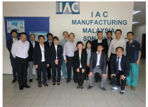
今井航空機器工業（株）マレーシア工場訪問